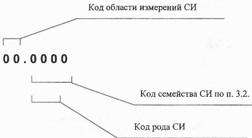
Рис.2 Структура кодов рубрик в систематизации СИ по областям измерений.

3.4. Перечни и коды областей измерений приведены в таблице 1.